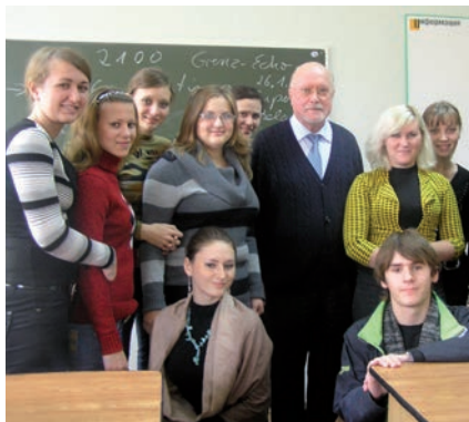
Клуб ФАН, главный корпус НГПУ, кабинет 410 ФИЯ (кафедра французского языка).