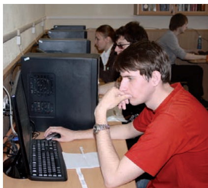
Олимпиадное движение по информатике, главный корпус НГПУ, кабинет 420 ИФМИЭО (кафедра информатики и дискретной математики).