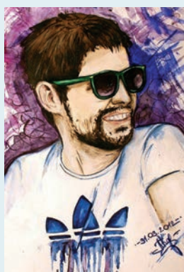
Автор рисунков – Карпович Полина