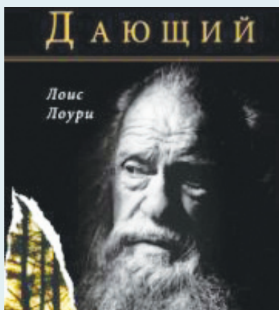
Л. Лоури «Дающий»

На мой взгляд, студенты-гуманитарии должны читать книги. В том числе и антиутопии. Книга Л. Лоури написана для подростков и юношества, но и людям старшего возраста она будет полезна. После выхода в 1993 году роман вызвал огромное количество споров, он даже попал в список книг, которые группы родителей пытались запретить, потому что считали, что с юными читателями нельзя говорить на такие серьезные темы. Но, несмотря на критику, книга вошла в школьную программу средних классов американской школы, получила множество престижных наград, включая медаль Ньюбери Американской библиотечной ассоциации.