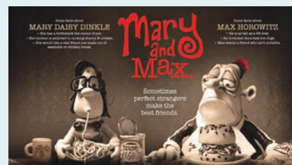
«Мэри и Макс», мультфильм

Кому: Романтичным и прагматичным юным леди. Когда-то на заре своей карьеры, работая в школе учителем истории, я очень переживала о том, что отношения с учениками складываются неидеально, эта книга в каком-то смысле помогла мне понять, что если ты по собственной инициативе что-то делаешь, не надо ждать благодарности. Возможно, познакомившись с данной повестью Альберта Лиханова, вы захотите прочесть и другие книги этого автора. Особенно это будет полезно тем, кто видит себя в будущем педагогом-новатором.