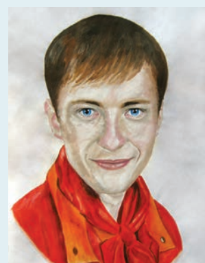
Автор рисунков – Забелич Надежда