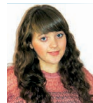
Голосы подготовила София Романенко

«Минута славы» прошла на ура – позволила ребятам проявить себя и скрасила учебные будни.