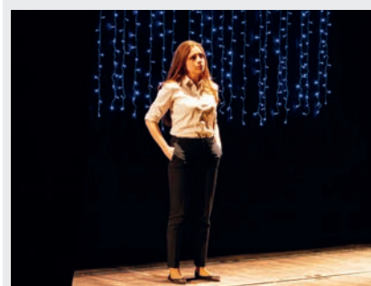
II городской поэтический фестиваль «Переплёт»