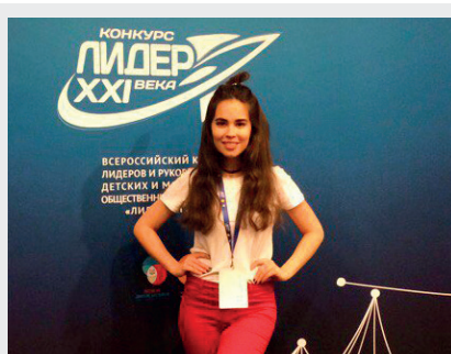
«Лидер 21 века»

С октября по апрель в несколько этапов прошел Всероссийский конкурс лидеров и руководителей детских и молодежных общественных организаций. На нем студентка 3-ого курса направления «Организация работы с молодежью» принимала участие в номинации «Руководитель молодежного общественного объединения 18-25 лет». Федеральный этап проходил в г. Москва и был разделен на три блока: самопрезентация, защита проекта и вариативный блок. Кроме конкурсных испытаний были и различные мастер-классы от экспертов в сфере молодежной политики, встречи с победителями прошлых лет, с представителями РДШ, а также ночная экскурсия по Москве.