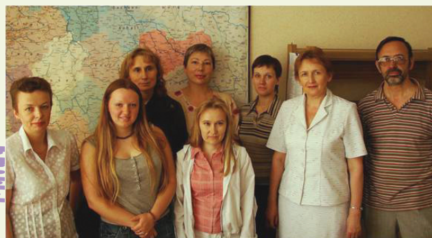
Кафедра немецкого языка ▶