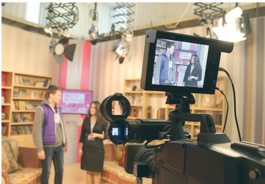
Корреспондентам студенческих пресс-центров предоставили настоящую телевизионную студию

– Главной задачей форума была организация связи между всеми вузами-участниками. Подразумевается, что каждый университет разрабатывает базовый план мероприятий по тому виду деятельности, который в этом вузе реализуется наиболее эффективно, а затем