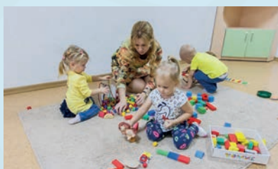
Региональный ресурсный центр НГПУ «Семья и дети»