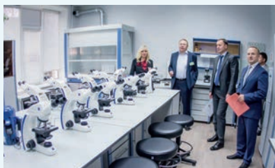
НОЦ ИЭСЭН НГПУ «Экспериментальная и прикладная биология»

В университете создана масштабная инновационная инфраструктура , которая включает интерактивные аудитории, новое аналитическое, измерительное и лабораторное оборудование; ресурсные центры по предметным областям; развитие современных цифровых сервисов для организации образовательного процесса; обновление материально-технического обеспечения.