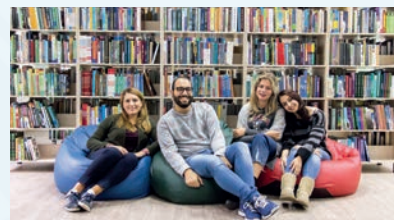
Модернизированная библиотека НГПУ с развитой ЭБС и открытой книговыдачей