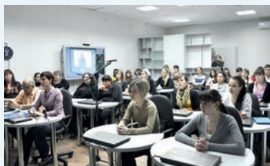
Ресурсный центр НГПУ «Цифровая школа»