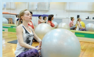
Фитнес-центр «Green Fitness».