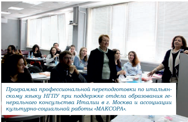
Программа профессиональной переподготовки по итальянскому языку НГПУ при поддержке отдела образования генерального консульства Италии в г. Москва и ассоциации культурно-социальной работы «МАКСОРА».

Повышение международной конкурентоспособности – одна из приоритетных задач нашего вуза. К своему 85-летию НГПУ сотрудничает с более чем сотней зарубежных организаций и привлекает к академическому взаимодействию студентов и преподавателей из более чем 30 стран мира. Занимаясь расширением международных образовательных, научных и культурных связей, НГПУ продвигает российское образование и культуру за рубежом. Какими направлениями международной деятельности НГПУ может гордиться сегодня – в материале «Всего университета».