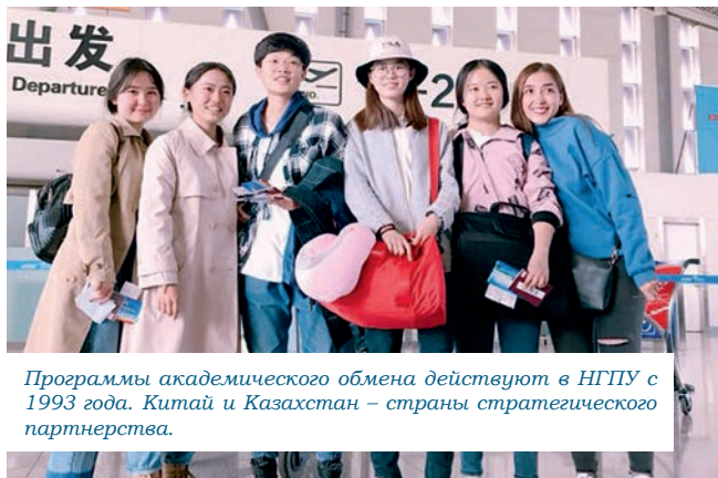
Программы академического обмена действуют в НГПУ с 1993 года. Китай и Казахстан – страны стратегического партнерства.