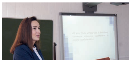
В КФ НГПУ делают акцент на исследовательской работе студентов

21 марта Куйбышевский филиал НГПУ отпраздновал свое 30-летие. За годы своего существования филиал занял собственную нишу в системе профессионального образования Сибирского региона, подготовив около семи тысяч дипломированных специалистов. Выпускники КФ НГПУ работают в образовательных учреждениях Новосибирской области и других регионов России, становятся победителями конкурсов «Учитель года» и «Сердце отдаю детям», а главное – обеспечивают детей сибирской глубинки качественным образованием и воспитанием.