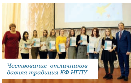
Чествование отличников – давняя традиция КФ НГПУ

Сотрудничество филиала с муниципальными органами позволяет оперативно удовлетворять запросы образовательных организаций 18 административных районов НСО. За последние три года в Куйбышевском филиале повысили квалификацию 1973 педагога, а 330 работников образования прошли обучение по программам профессиональной переподготовки.