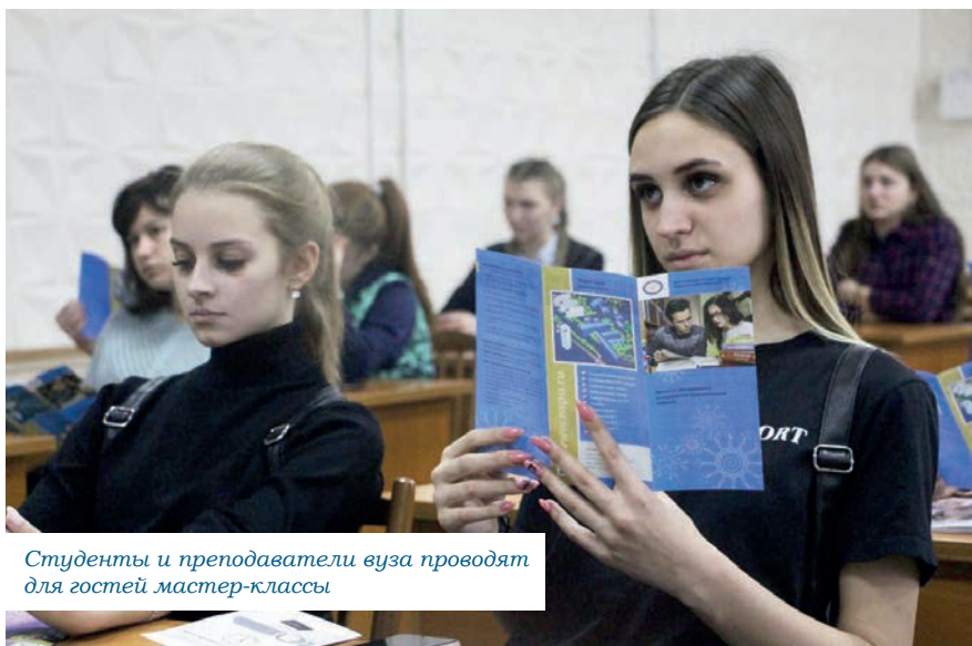
Студенты и преподаватели вуза проводят для гостей мастер-классы

В стенах НГПУ вы не только приобретаете востребованную профессию, но и развиваете свои таланты. Главным образом мы готовим работников для региональной сферы образования и считаем, что приобретение студентами различных дополнительных компетенций позволяет им в дальнейшем быть более интересными и конкурентоспособными на рынке труда.