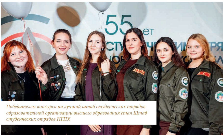
Победителем конкурса на лучший штаб студенческих отрядов образовательной организации высшего образования стал Штаб студенческих отрядов НГПУ.

30 ноября состоялось Торжественное закрытие III трудового семестра Новосибирского регионального отделения молодежной общероссийской общественной организации «Российские студенческие отряды». В этом году движению студотрядов Новосибирской области исполнилось 55 лет. По этому случаю были организованы различные мероприятия, а также приглашены представители движения из других регионов Сибирского федерального округа.