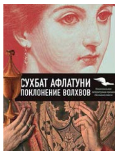
Сухбат Афлатуни «Поклонение волхвов»

Сочащаяся волшебством, затягивающая и невероятная книга Мариам Петросян стала литературной сенсацией в две тысячи девятом. Роман собрал восторженные отзывы, кажется, всех литературных критиков. Получил «Студенческий Букер», «Русскую премию» и победил в читательском голосовании «Большой книги». Породил гигантское фанатское сообщество. А в этом году вышло долгожданное, по-настоящему фанатское переиздание романа – на этот раз с картинками, созданными поклонниками книги и одобренными автором, и с добавленными эпизодами (около сорока дополнительных страниц).