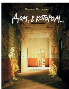
Мариам Петросян «Дом, в котором...»

Новый многофигурный исторический роман Алексея Иванова о Сибири в петровские времена. Как «Игра престолов», только на отечественной почве: шаманы и царедворцы, пленные шведы и русские «гулящие люди», солдаты и рудознатцы, интриги, любви и подвиги в пространстве от недостроенного Петербурга до собственно Тобола. Тяжело и со скрипом проворачиваясь поначалу, густонаселенная и плотная ивановская вселенная в какой-то момент раскрывается до таких бешеных оборотов, что семьсот страниц уже не покажутся избыточными.