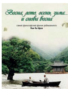
«Весна, лето, осень, зима... и снова весна» (Ким Ки Дук, Юж. Корея/Германия, 2003)

встречает отпор со стороны девушки. Поначалу он изображает безразличие, но проходит время – и молодой человек понимает, что к нему впервые пришло настоящее чувство. Благодаря этому фильму в Советском Союзе впервые появилось понятие «культовое кино». А песня «Когда весна придет» надолго стала символом этого времени года.