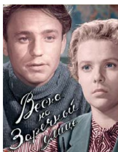
«Весна на Заречной улице» (Марлен Хуциев, Феликс Миронер, СССР, 1956)

Этот писатель-натуралист известен как автор рассказов о природе, ориентированных на младших школьников. Но если заглянуть в его творчество глубже, можно увидеть идеально ритмичные, простые и эмоциональные тексты. В названный сборник рассказов входят произведения, восхваляющие весну и показывающие всю ее красоту.