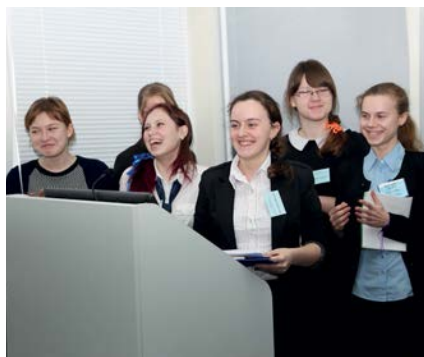
Работа журналиста – это не только сбор материала, но и публичные выступления.

Победив в номинации «Пресс-центр года», «Горностай» вошёл в «Мастерлигу» конкурса и получил право в течение года обучать других: проводить мастер-классы, организовывать пресс-конференции и другие мероприятия. А «Мультимедийный прорыв» в НГПУ положительно оценили все его участники, поэтому третий этап конкурса может стать традиционным.