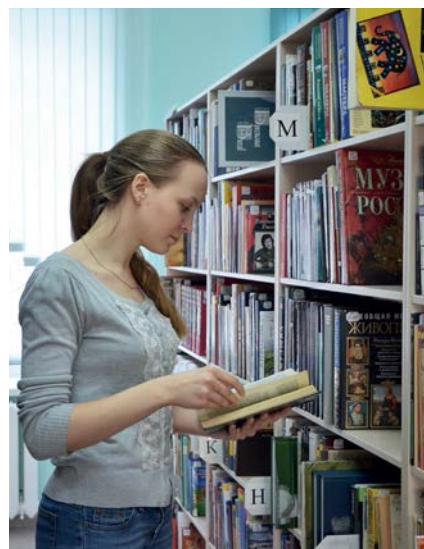
Открытая книговыдача позволяет студентам самостоятельно подбирать нужную литературу, значительно ускоряя этот процесс.

бятиях. В скором времени мы планируем открывать на нем тематические электронные коллекции (ближайшая – к девятому мая, посвященная нашим преподавателям, участвовавшим в Великой Отечественной войне). Продолжает функционировать и Центр редкой книги с уникальным для нашего города доступом к материалам Президентской библиотеки имени Ельцина, – отметила Людмила Николаевна.