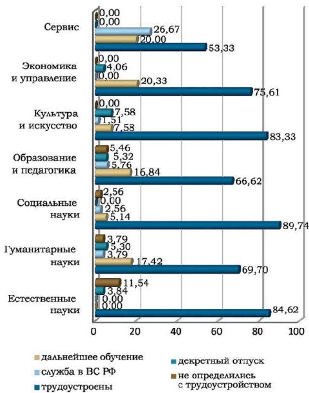
Рис. 3. Распределение выпускников по каналам трудоустройства по отдельным УГС/УГН, % (сентябрь 2014 г.)