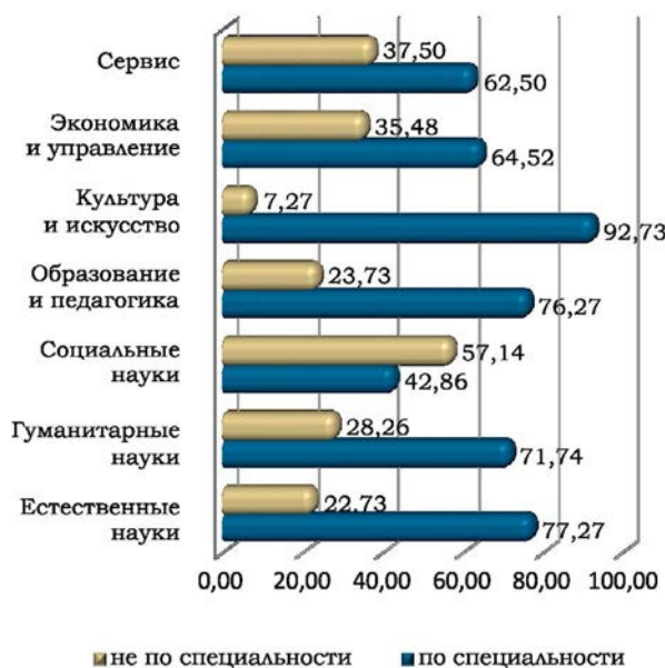
Рис. 4. Соотношение выпускников, трудоустроенных по специальности и не по специальности, в отдельных УГС/УГН, % (сентябрь 2014 г.)