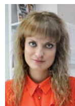
Полосы подготовила Анастасия Федорова

Со всеми результатами мониторинга центров можно ознакомиться на сайте Координационно-аналитического центра содействия трудоустройству выпускников учреждений профессионального образования.