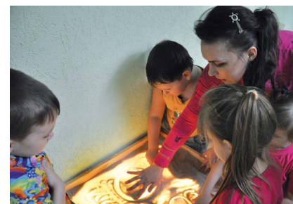
С педагогом ребята осваивают необычный вид творчества – рисование на песке.