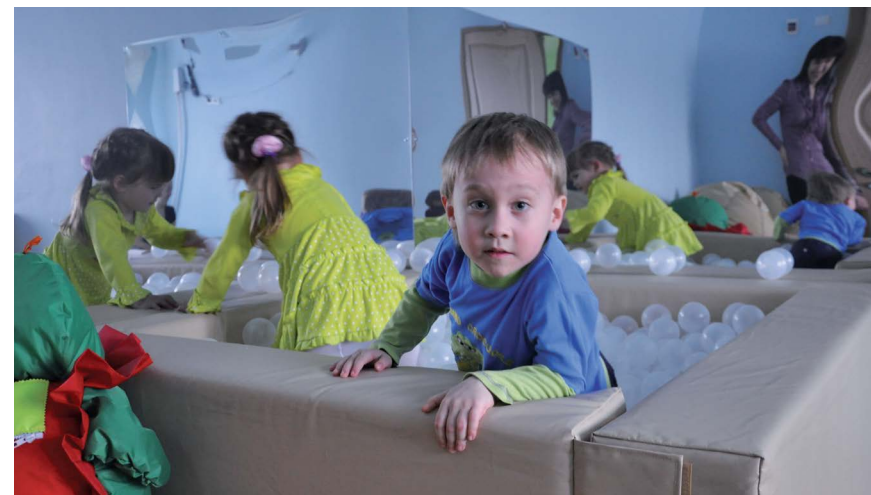
В Региональном ресурсном центре НГПУ «Семья и дети» развитие творческих и познавательных способностей детей происходит в веселой и интересной форме.

дети». Но ряды работников пополняются, центр становится местом подготовки высококвалифицированных кадров.