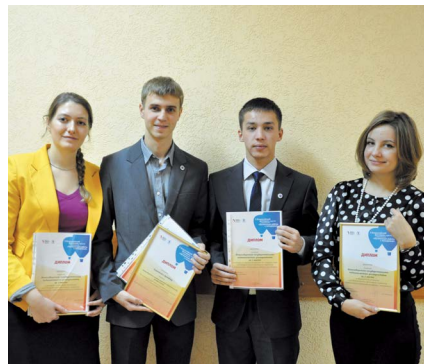
Студенты ИМПИСР НГПУ регулярно побеждают в фестивалях и конкурсах профессионального мастерства.

– ИМПИСР дал мне не только знания, но и практические навыки общения с разными людьми. Институт подарил мне людей, с которыми я продолжаю дружить и сегодня. Самые яркие впечатления студенчества связаны с насыщенной внеучебной деятельностью. ИМПИСР всегда отличался тем, что все мероприятия – это настоящие праздники, которые невозможно забыть. ИМПИСР – это та часть моей жизни, без которой я не могу себя представить.