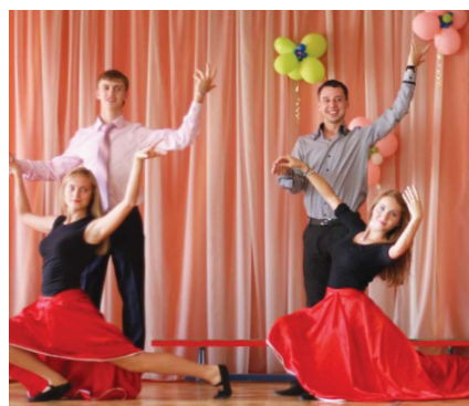
В ИМПИСР НГПУ сильные традиции, одна из которых – празднование Дня рождения института.