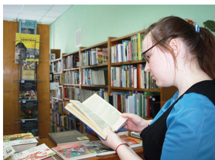
Каждый год 16 000 читателей библиотеки НГПУ получают около 400 000 книг.