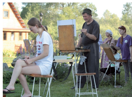
Творческий процесс полностью поглощал участников пленэра.

– Мне выездные пленэры нравятся гораздо больше городских. Это воз-