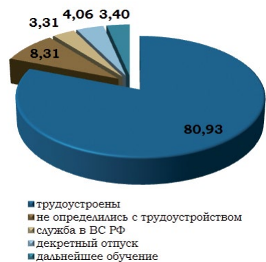
Рис. 1. Распределение выпускников по каналам трудоустройства, % (август 2013 г.)