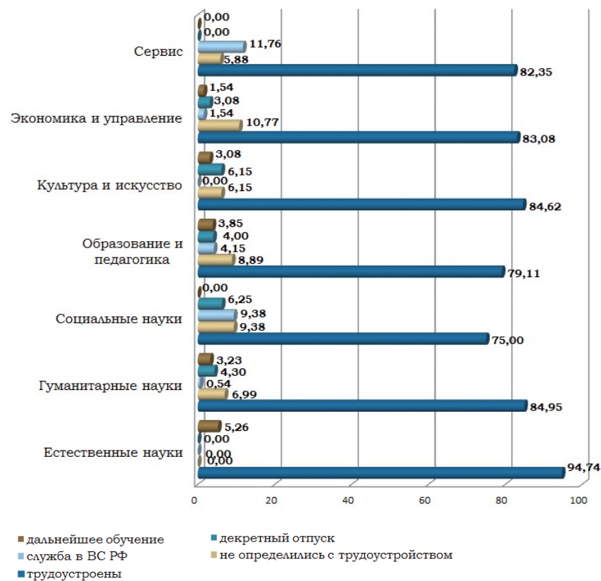
Рис. 3. Распределение выпускников по каналам трудоустройства в отдельных УГС/ УГН, % (август 2013 г.)

При этом максимальный процент трудоустройства по специальности наблюдается в группе «Культура и искусство» (78,18 %), минимальный – в группе «Социальные науки» (45, 83 %) (рис.4). Стоит отметить, что выпускники