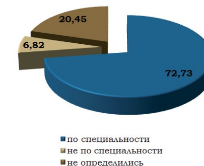
Рис. 5. Соотношение неопределившихся с трудоустройством выпускников по планам относительно их будущего трудоустройства, % (август 2013 г.)

Небольшой процент (4,06%) выпускников уже находятся или пла-