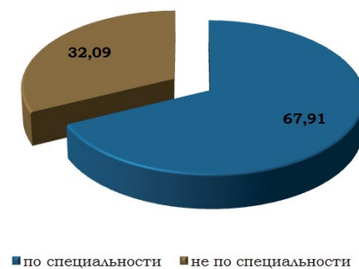
Рис. 2. Соотношение выпускников, трудоустроенных по специальности и не по специальности, % (август 2013 г.)

ки УГС/УГН «Образование и педагогика» в большинстве своем трудятся по полученной специальности – 67,98 %.