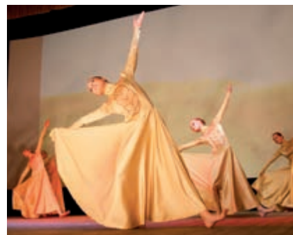
Получен грант в размере 30 млн руб. на реализацию Программы развития деятельности студенческих объединений на 2012-2013 годы.