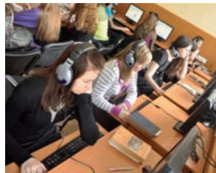
Победа в федеральном конкурсе программ стратегического развития вузов принесла университету 300 млн.руб. дополнительного финансирования на 2012-2014 годы.