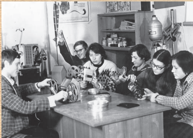
В те годы в институте был известен кружок фотолюбителей на базе физико-математического факультета. Тогда фотодело являлось сложным техническим процессом. На фото: кружок фотолюбителей.