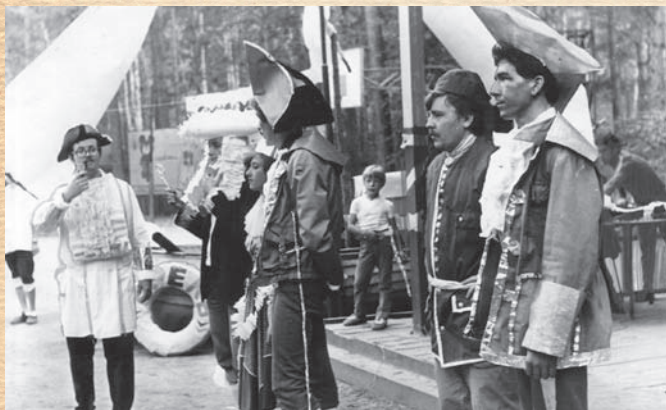
Самой интересной частью процесса обучения была и остается летняя практика в детских оздоровительных лагерях. Молодые педагоги ездили во Всесоюзные пионерские лагеря «Артек» и «Океан» и Всероссийский лагерь «Орленок». В 80-х годах «Клуб ребячьих комиссаров», «Беспокойные сердца» сформировали костяк вожатских отрядов многих летних лагерей. На фото: вожатые-студенты в летнем детском лагере.