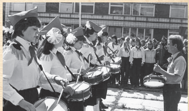
Перед началом летней практики в пионерских лагерях будущие вожатые проходили пятидневный инструктивный сбор в лагере. Через эту «школу вожатых» прошли около 8 тысяч студентов второго и третьего курсов. На фото: 1985 г. Инструктивный сбор в лагере «им О. Кошевого».

В 1989 году открыт факультет дополнительных педагогических профессий (сейчас факультет культуры и дополнительного образования). Главная задача – помочь студентам реализовать свои способности и научиться руководить детским творческим процессом. «Смежных» специалистов оказалось много – психолог, методист внеклассной работы, организатор школьного кружка.