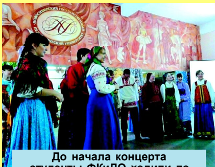
До начала концерта студенты ФКиДО ходили по главному корпусу и зазывали гостей на праздник