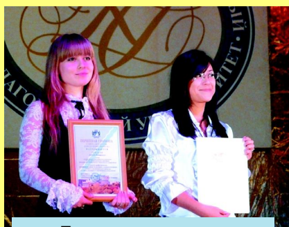
Лучшие студенты получили награды

Зрители смогли насладиться хорошо знакомыми и всем полюбившимися номерами: испанскими танцами и народным