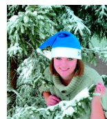
полосы подготовила Юлия Торопова

что он это придумал, а в том, что это подхватили, начали на так называемом «новом искусстве» спекулировать. Как у нас, например, после революции занялись уничтожением «буржуазного искусства». Но это шарлатанство сплошное. Ну, ничего, время разберется.