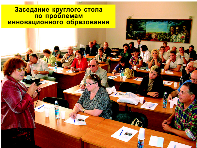
Заседание круглого стола по проблемам инновационного образования