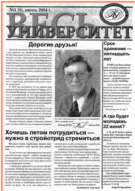
В июне 2004 года вышел пилотный номер газеты «Весь университет». Скромно, но с «главным лицом вуза» на обложке.