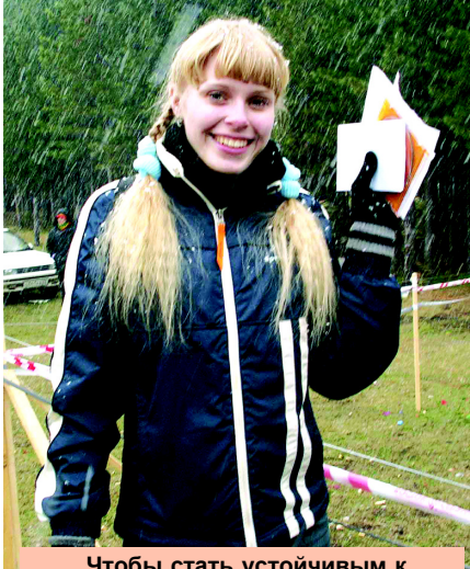
Чтобы стать устойчивым к стрессам, надо в первую очередь быть морозостойчивым. Поэтому даже в лютый мороз хрупкие журналистки «ВУ» выходят на «тропу войны».