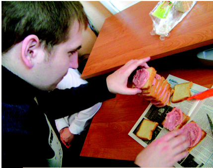
Хороший журналист — голодный журналист. Но в нашей редакции такое правило не прижилось. Ребята всегда любят плотно и вкусно покушать.