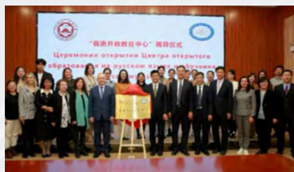
Международный научно-методический центр сопровождения преподавателей РКПИ Структурное подразделение вуза

– По итогам проведенного анализа ситуации, нормативных документов и прочих условий, мы пришли к выводу, что при выборе китайского партнера прежде всего стоит учитывать его заинтересованность и мотивацию, а также статус образовательного учреждения в системе образования КНР и только после этого географический фактор и экономическую ситуацию в регионе сотрудничества. Мы считаем, что не стоит ограничиваться северо-восточной частью Китая, где взаимодействие с Россией налажено уже давно, а расширить географию сотрудничества на западные и южные провинции, где в последние годы появились значительные русские диаспоры.