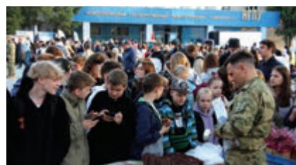
Угоститься кашей и сладким чаем на полевой кухне – любимое развлечение для детей и подростков. А подкрепившись – вновь отправиться соревноваться в быстроте, ловкости и меткости под руководством студентов-аниматоров.