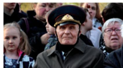
Коллектив студентов собрал вокруг себя зрителей не только из одноклассников и сотрудников вуза: на праздник пришли жители из близлежащих домов, а также главные герои Дня Победы – ветераны.

В этот же день, 5 мая, состоялся финал V конкурса чтецов «По страницам памяти». Отборочный тур собрал на сайте НГПУ более 90 участников из большинства районов Новосибирской области и города Новосибирска. В финал конкурса вышли 17 чтецов в трех номинациях – «Поэтическое произведение», «Прозаическое произведение», «Произведение собственного сочинения».