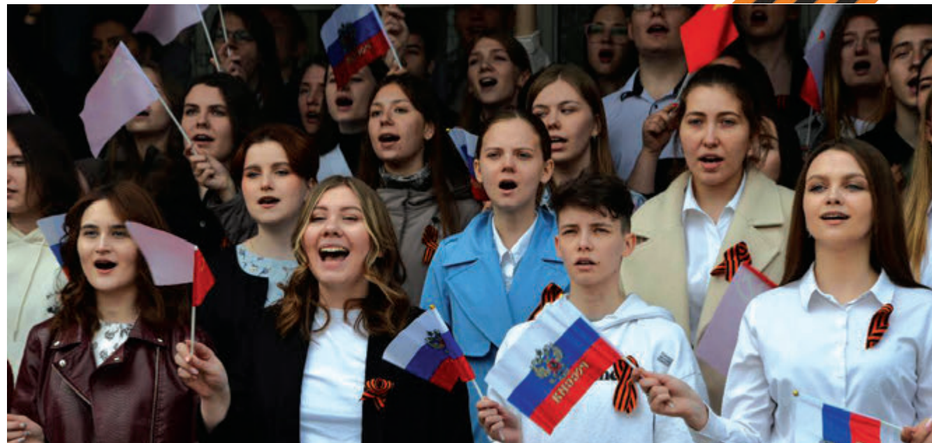
Праздник на площади перед НГПУ состоялся в рамках всероссийской акции «Голос Победы», объединившей тысячи школьников и студентов. Организаторами мероприятия являются Министерство науки и высшего образования совместно с Федеральным агентством по делам молодежи.